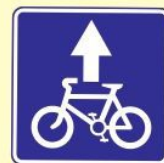
Полоса для велосипедистов