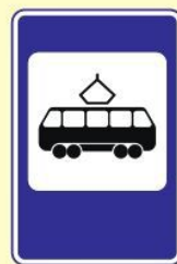
Место остановки трамвая