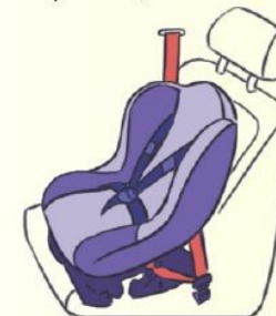
Лицом по ходу движения