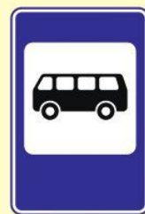
Место остановки автобуса и (или) троллейбуса

ПРАВИЛА ДОРОЖНОГО ДВИЖЕНИЯ ОДИНАКОВЫ ДЛЯ ВСЕХ – ВЗРОСЛЫХ И ДЕТЕЙ!